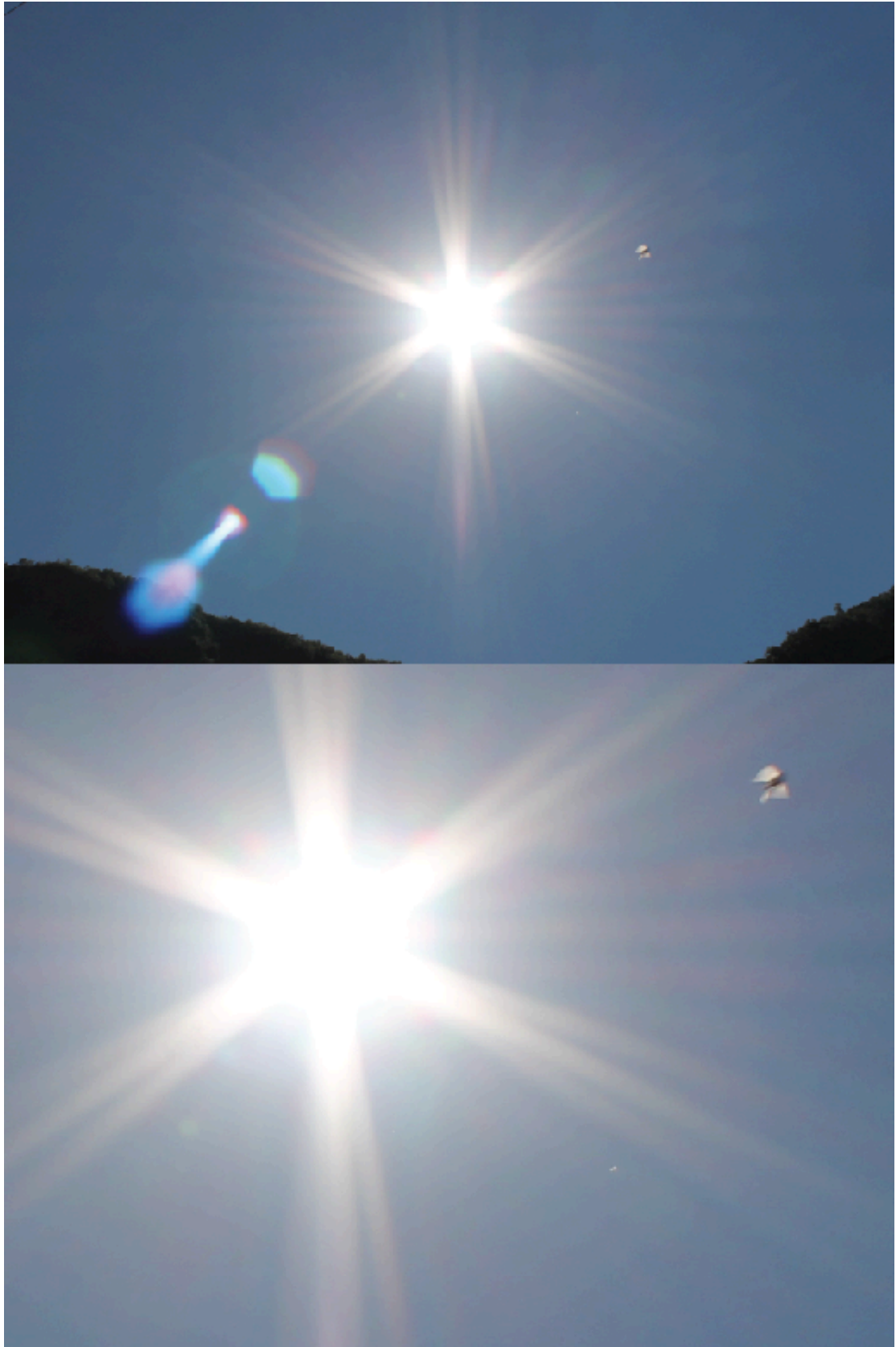
Foto tomada el mes de mayo de 2012 en Machupichu, Perú por Gerardo Amaro.