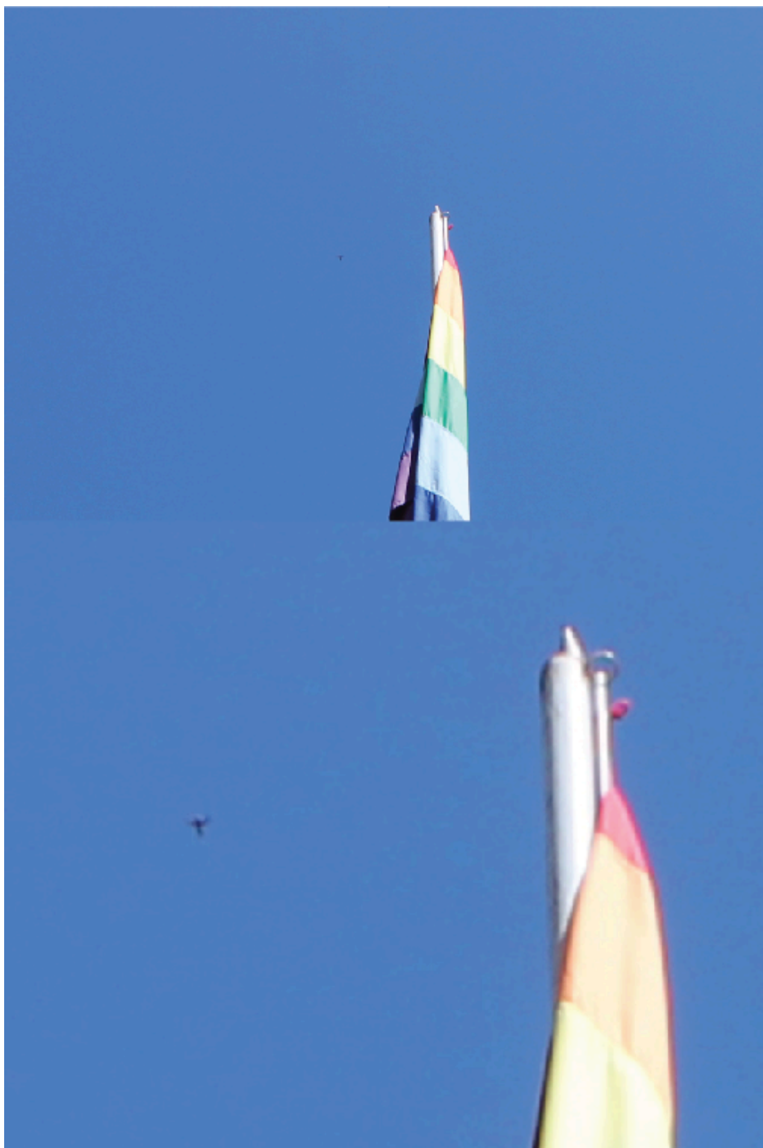
Foto tomada el mes de mayo de 2012 en Machupichu, Perú.